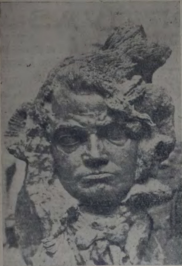
STEPAN ERZIA "Beethoven"