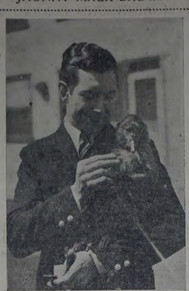
EL CELEBRADO ACTOR DE LA METRO GOLDWIN MAYER HACIENDO AMISTAD CON UN SIMPÁTICO E INTELIGENTE SIMIO.