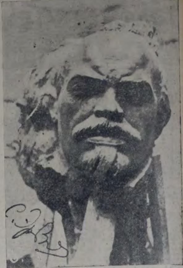
STEPAN ERZIA "Lenin"