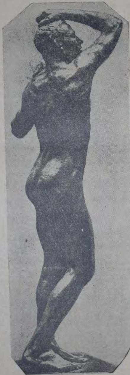
"EL DESPERTAR DEL HOMBRE"