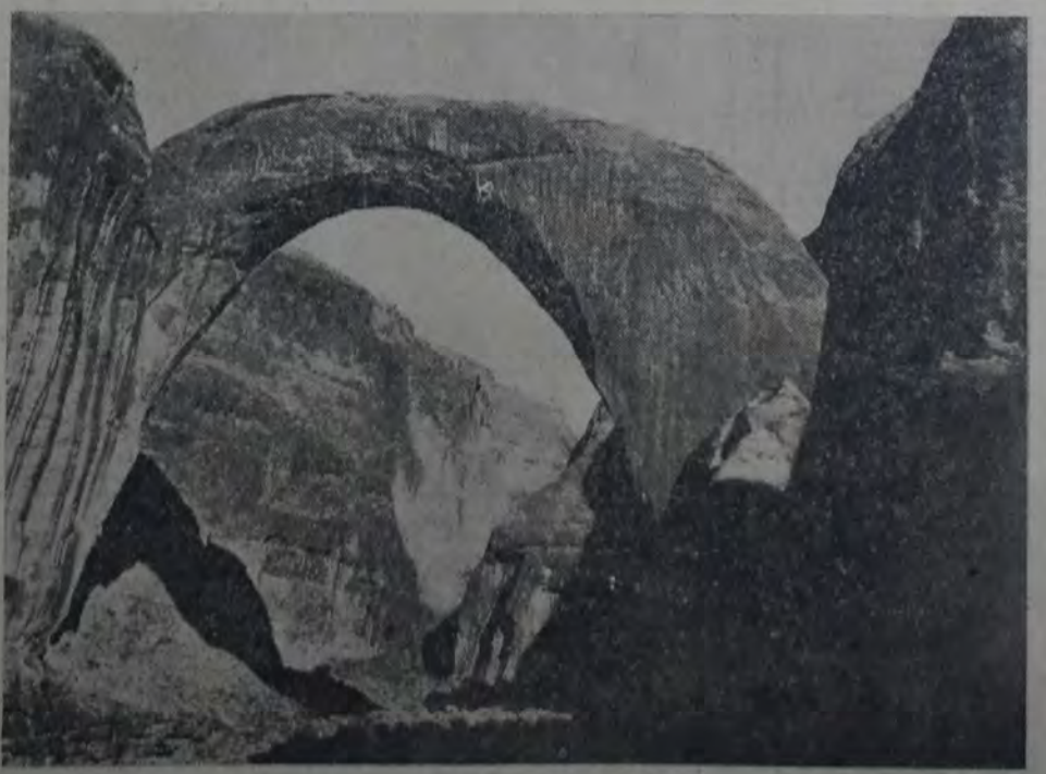
PUENTE LLAMADO DEL ARCO IRIS, SITUADO EN LA COMARCA DE NAVAJO, EN EL ESTADO NOROCCIDENTAL DE MICHIGAN, EN EL ESTADU NOROCCIDENTAL DE MICHIGAN, EN EL ESTADU NOROCCIDENTAL DE MICHIGAN.